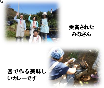
受賞されたみなさん

ファームの集いの場をお借りして、ふれあい賞(上半期)の授賞式を行いました。ふれあい賞とは、最も長い時間ふれあいで過ごした方5名に贈られる賞で、受賞者には金一封が授与されました。3位~1位にはお菓子でできたメダルを、1位にはさらにおめでとうと書かれたたすきを掛けて1日を過ごしてもらいました。ファームの集いでは、清々しい秋晴れの下、すずらん会のみなさんが作ってくださったカレーや果物などを沢山いただきました。(H)