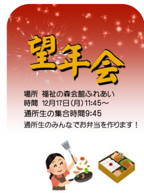
メンバーさん作成のポスター

発行日 2018年12月 特定非営利活動法人ふれあい 〒306-0044 茨城県古河市新久田2-7-1 古河福祉の森会館内 ☎/fax0280-48-5878 e-mail info@fureai-net.org http://fureai-net.org