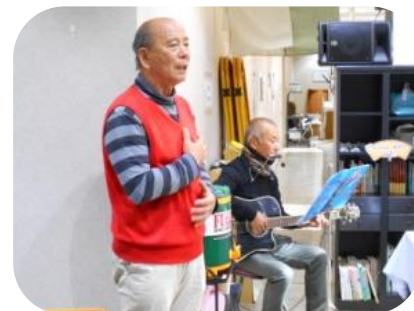
スタッフによるライブ