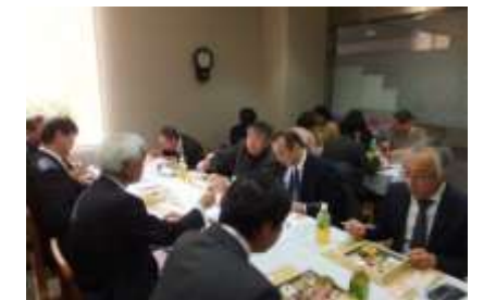
たくさんの来賓の方々 (ほっと cafeにて)