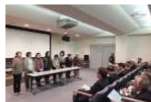
すずらん会 ハンドベル