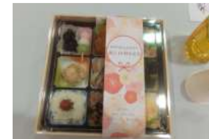
ふれあいスタッフとメンバーさんで作った会食用のお弁当