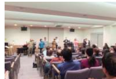
ふれあいによる手話歌 (TOMORROW)