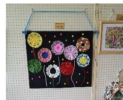
ふれあいの作品「おり紙花火」