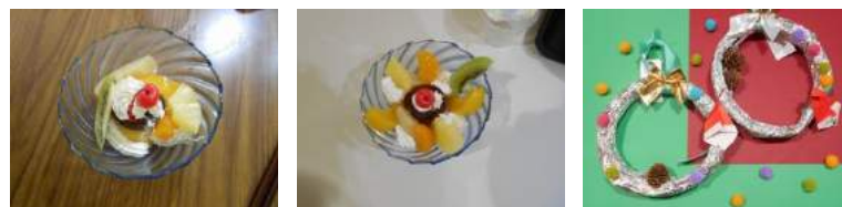
左・中 プリンアラモー 右 クリスマスリース