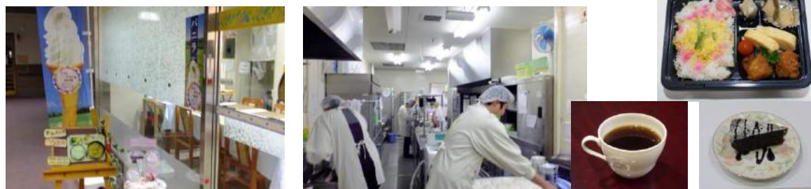
ほっと cafe 入口

最初は1時間しか働けない人や声の小さい人もいますが、今できることをひとつひとつクリアしていくことで体力をつけ、自信に繋がっていきます。今はデイサービスの調理やお弁当作りなど活躍の場も広がっています。Cafeのなかでいきいきと働くメンバーさんの姿を見に来てください。