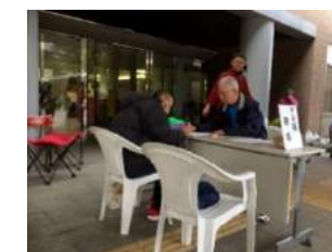
フリマ会場でも「マル福」署名活動が行われました。