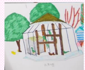
タイトル：孔雀の檻

久しぶりの散歩も兼ね歩いて公園まで行きました。ちょうど同時期に開催予定だった桃祭りはあいにく開催されていませんでしたが、多くの方が満開の桃の花を見に訪れていました。東屋に到着すると、上半期ふれあい賞5位から1位の表彰を行い、桃の花を背景に写真撮影をしました。受賞者にはそれぞれ順位に応じた給食ランチ券が贈呈されました。