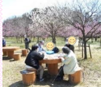
何を描いているのかな？