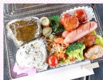
ほっと cafe のお弁当