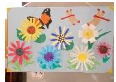
タイトル：満開 (koga インクルーシブ)