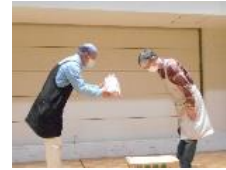
ボーリング大会表彰式