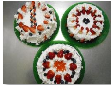
ケーキデコレーション