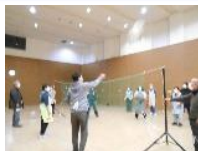
バレーボール大会 (マスポーツ教室)