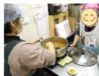
20人分のカレー作りに挑戦