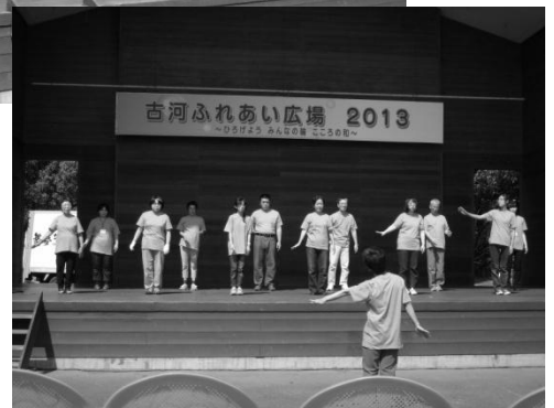
※ 去年の発表の様子です