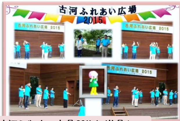
古河ふれあい広場 2015 に出場！

9月26日(土)ふれあい広場出場！今年は「涙そうそう」と「オー!シャンゼリゼ!」を披露しました。練習の成果を存分に発揮できました。